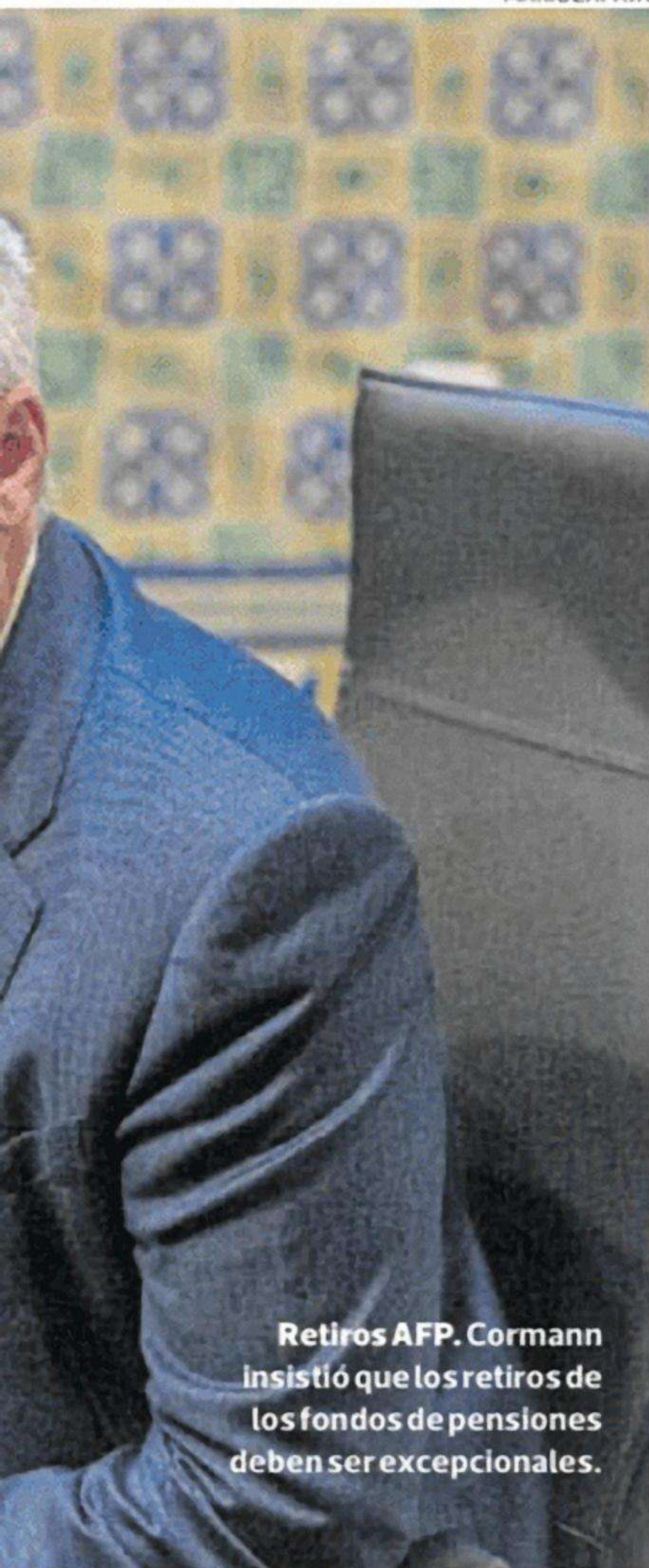
Retiros AFP. Cormann insistió que los retiros de los fondos de pensiones deben ser excepcionales.

nuevos beneficios tributarios. Si bien también compete al Gobierno, el Congreso los impulsa primero. ¿Cómo evalúan esa dinámica de aprobación?